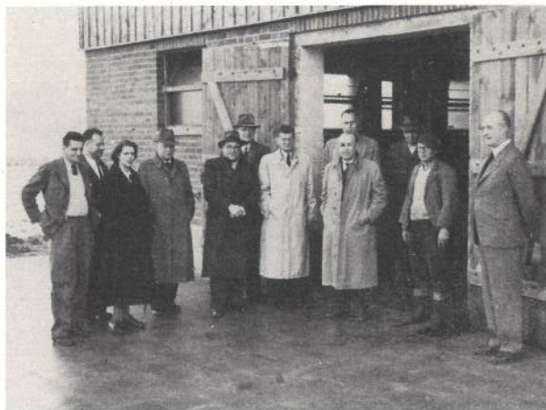
Die in Bonn akkreditierten Landwirtschaftsattachés Schwedens, Dänemarks, Hollands und Belgiens stateten der Forschungsanstalt einen Besuch ab.

die Confédération générale de l'agriculture in Paris mit ihren Zweigorganisationen, das Landbouw-Economisch-Instituut in Den Haag, sowie die Einrichtungen der OEEC in Genf und Rom besucht. In der Folgezeit konnten diese Besuche fortgesetzt und ihre Ergebnisse durch einen regen Erfahrungsaustausch vertieft werden. Besonders wertvoll war es auch, die landwirtschaftlichen Buchführungsorganisationen und einzelne von ihnen erfasste Betriebe kennenzulernen. Das Zahlenmaterial der Buchführungsstatistik konnte daher schon wiederholt zu vergleichenden Untersuchungen der Erzeugungsbedingungen verwendet werden. Vor allem ergaben sich aus diesen Auslandsbeziehungen wertvolle Anregungen für die im Institut entwickelte Methode der Produktionskostenberechnung an Betriebsmodellen.