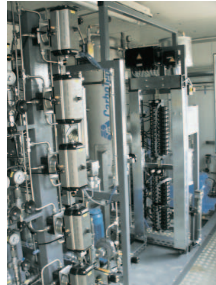
Abb. 2: Reformer zur Umwandlung von Biogas in Wasserstoff.

Vergärungsverhalten von potenziellen Energiepflanzen abzuschätzen. Durch Innovationen bei der Nutzung des Gases und der Gärückstände ließe sich die Wirtschaftlichkeit und Nachhaltigkeit der Biogastechnik weiter verbessern. ■