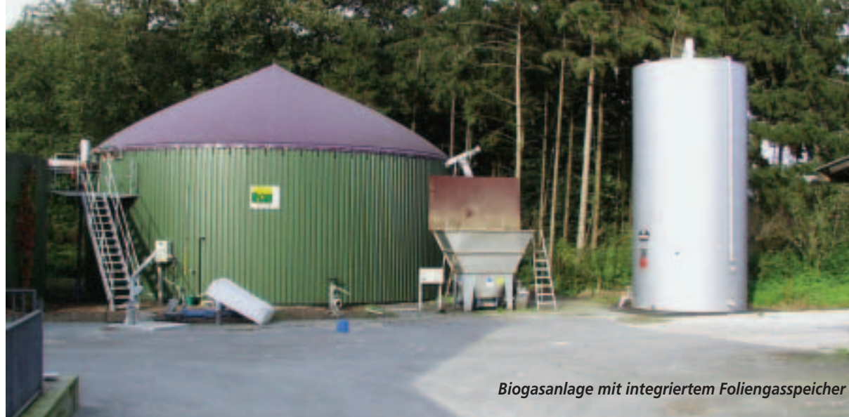
Biogasanlage mit integriertem Foliengasspeicher