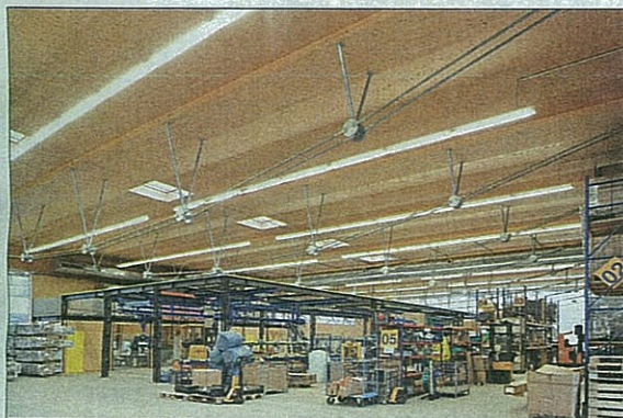
Produktionsgebäude für Fahnenmasten in Arnberg