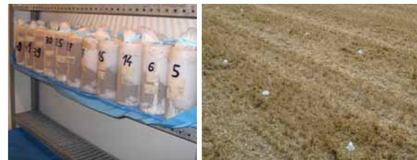
Abbildung 2: Mesokosmen mit Boden, Stroh und Bodentieren: links in Klimakammer; rechts eingegrabene Mesokosmen im gemulchten Feld

können erhebliche Ertragsverluste und qualitative Beeinträchtigungen des Ernteguts auftreten. Arten der Gattung Fusarium zählen weltweit zu den bedeutendsten Schadpilzen, da sie häufig auftreten und Pilzgifte (Mykotoxine) produzieren. Aufgrund der potenziellen Gesundheitsgefahr hat die EU Höchstmengen für verschiedene Mykotoxine in pflanzlichen Rohstoffen und Lebensmitteln festgelegt. Bei Überschreiten der Grenzwerte darf das Erntegut nicht in den Handel gelangen. Eines der in Getreide am häufigsten nachgewiesene Mykotoxin ist das zu den Trichothecenen zählende Deoxynivalenol.