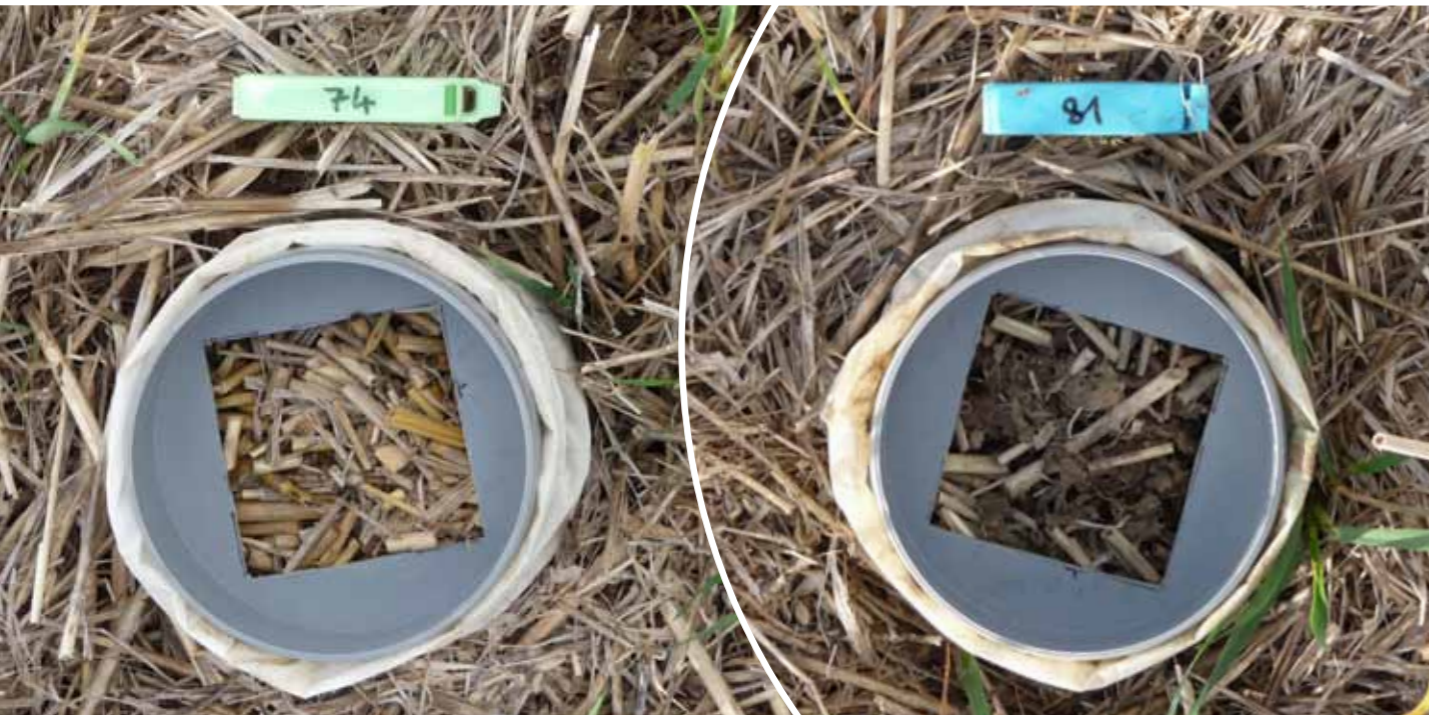
Abbildung 3: Blick in zwei Boden-Mesokosmen nach acht Wochen Exposition im Feld: links Kontrolle ohne Bodentiere; rechts Variante mit Regenwurm-Aktivität

Fusarium culmorum nach acht Wochen zu 98 Prozent abgebaut hat. Die Deoxynivalenol-Gehalte waren bereits zu 99 Prozent gegenüber Versuchsbeginn reduziert. Neben direktem Fraß ist die Förderung mikrobiellen Abbaus von Fusarien und ihrer Toxine wahrscheinlich. Der von Regenwürmern bei der Fortbewegung an die Umgebung abgegebene Körperschleim enthält biologisch leicht abbaubare Verbindungen, die als Initialzündung für erhöhte mikrobielle Aktivität dienen, die wiederum den Abbau von Fusarien und ihrer Toxine beschleunigt.