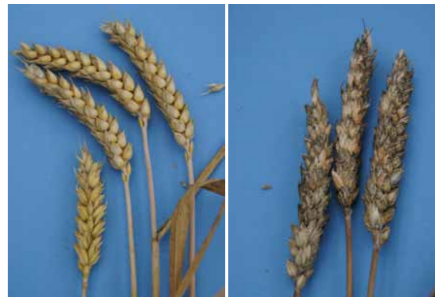
Abbildung 1: Ähren der Winterweizensorte „Ritmo“ nach der Ernte: links gesunde Ähren; rechts mit Fusarien befallene Ähren zeigen das Krankheitsbild der partiellen Taubährigkeit

Bei Getreide kann ein Befall mit Schadpilzen der Gattung Fusarium Krankheiten im Bestand auslösen. Dies führt unter anderem zu Symptomen der Ährenfusariose mit partieller Taubährigkeit (Abb. 1). Als Folge