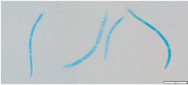
Abb. 3. Konidien von Septoria alni (gefärbt mit Wittmann's Blau).

14,03–43,44 × 0,76–2,11 µm (im Durchschnitt 27,33 × 1,53 µm) (Abb. 3).