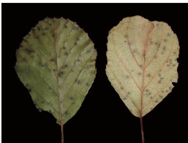
Abb. 1. Symptome an den Blättern (links Blattoberseite, rechts Blattunterseite).