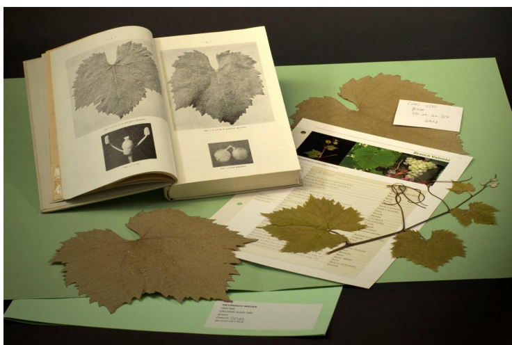
Abb. 2: Ampelographische Literatur, Herbarbelege und Fotos von den für die Sortenerkennung wichtigsten morphologischen Organen Triebspitze, Blatt und Traube.

Ziel war es, die Rebsortenvielfalt des osteuropäischen Raumes genetisch und morphologisch zu beschreiben, zu evaluieren und die Sortenidentität eindeutig zu belegen. An der genetischen Charakterisierung beteiligten sich 20 Sortimente aus 13 Ländern. Von 997 Akzessionen wurden die genetischen Fingerabdrücke angefertigt und verglichen. Sie gehörten zu 659 verschiedenen Rebsorten (MAUL et al. 2015b). Außerdem wurden die allelischen Profile mit internationalen Markerdatenbanken, publizierten Fingerabdrücken und dem VIVC abgeglichen. Als Ergebnis waren drei Fälle möglich: (1) Identische Akzessions-/Sortennamen und identische Markerprofile = der Idealfall, (2) Identische Akzessionsnamen und unterschiedliche Markerprofile und (3) Identische Markerprofile und unterschiedliche Akzessionsnamen. Die Herausforderung bestand darin festzustellen, welcher Akzessionsname ein echter Sortenname/echtes Synonym, ein echtes Homonym oder eine Falschbezeichnung darstellte. Durch Verwendung ampelographischer Literatur, Herbarbelege und Fotos (Abb. 2) konnte für 306 Rebsorten die Identität eindeutig bestätigt werden. Beispiele für die Fälle 2 und 3 sind in Tab. 1 zu finden.