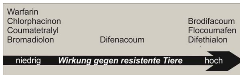
Abb. 3. Wirksamkeit von antikoagulanten Wirkstoffen bei Tyr139Cys Wanderratten und Tyr139Cys, Leu128Ser oder sretus-Typ Hausmäusen (Esther et al. 2014).

Die neusten Forschungsergebnisse zeigen, dass neben den Antikoagulanzen der ersten Generation (Warfarin, Coumatetralyl, Chlorphacinon) auch Bromadiolon unwirksam ist, wenn die genannten VKOR-Sequenzänderungen bei Hausmäusen und Wanderratten vorliegen (Abb. 3, Endepols und Esther in Bearb.). Auch bei der Anwendung von Difenacoum muss mit unzureichender Wirksamkeit gerechnet werden. Mit Brodifacoum, Flocoumafen und Difethialon sollte eine erfolgreiche Bekämpfung möglich sein. Wegen ihrer potenziell umweltgefährdenden Eigenschaften sollten Bekämpfungsmittel mit diesen Wirkstoffen nur nach sorgfältiger Risikoanalyse und unter Beachtung entsprechender Risikominderungsmaßnahmen angewendet werden (Esther et al. 2014).