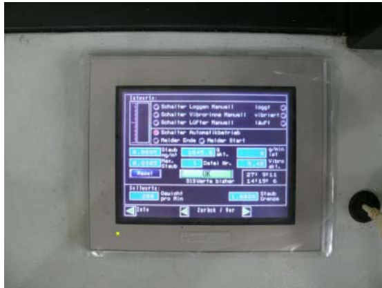
Abb. 4: Der mit Staub beladene Luftstrom wird durch ein Photometer geleitet.

Schaltkasten: Schaltschrank aus Stahlblech mit einem Panel mit Touch-Screen auf der Oberseite sowie den Schaltern „Spannungsversorgung Ein/Aus“, „Automatik Ein/Aus“, „Manueller Datenleser Ein/Aus“, „Manuell Lüfter Ein/Aus“, „Manuell Vibrationsrinne Ein/Aus“. Ferner ein Regler zur manuellen Einstellung der Vibrationsrinne. An der Seite des Schaltschranks zusätzlich eine Messeinrichtung für Lufttemperatur und Luftfeuchte. Erforderliche Anschlüsse: 1 x 240 V, 1 x Luftdruckversorgung, 1 x Anschluss an die Aspiration.