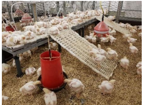
Erhöhte Ebenen bei der Masthühnerhaltung

Ziel: Hauptziel dieses Projektes ist es, den Einsatz von antimikrobiellen Mitteln, die in der Tierhaltung eingesetzt werden, und die daraus resultierenden Rückstände in der Nahrungskette und in der Umwelt zu reduzieren, indem die Tiergesundheit und das Wohlbefinden der Tiere in landwirtschaftlichen Betrieben verbessert werden.