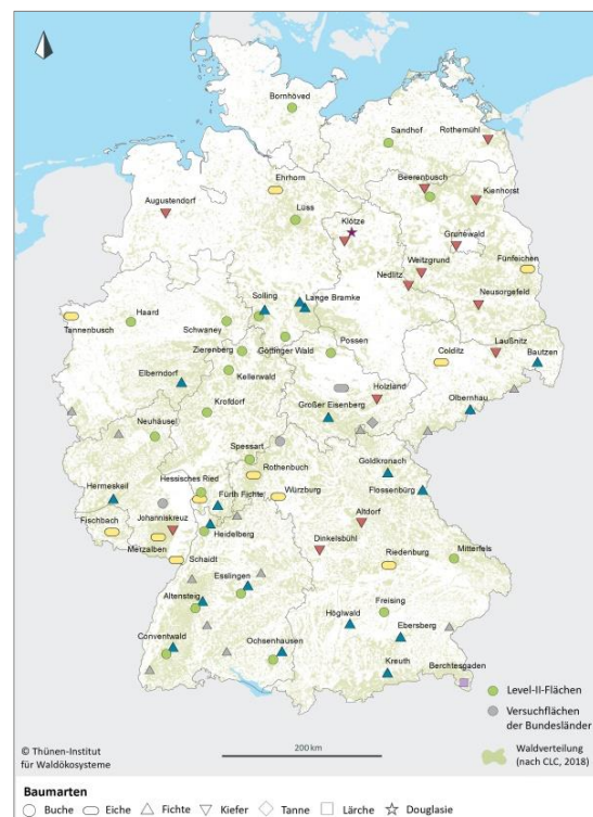
Abbildung 1: Die 68 Flächen des intensiven forstlichen Umweltmonitorings (Level II) in Deutschland