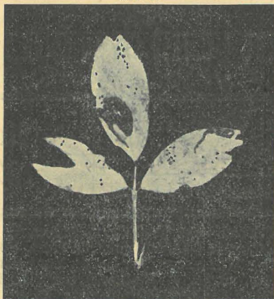
Luzerneblatt. In jedem Blättchen eine Mine von Phytomyza affinis Fall.

durchsetzt. Diese Minen beginnen bekanntlich mit einem mehr oder weniger geschlängelten Gang in der Mitte der