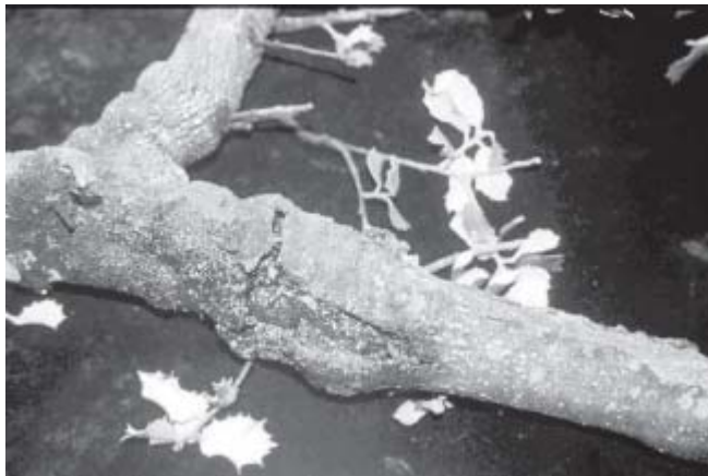
Abb. 3. Rindenkrebsgeschwür mit nekrotischen Läsionen und Exsudaten an einem Zweig von Quercus ilex .

Eicheln wurde in Spanien erst später entdeckt. Exsudate wurden dort auch an den Blattknospen bei Quercus pyrenaica beobachtet.