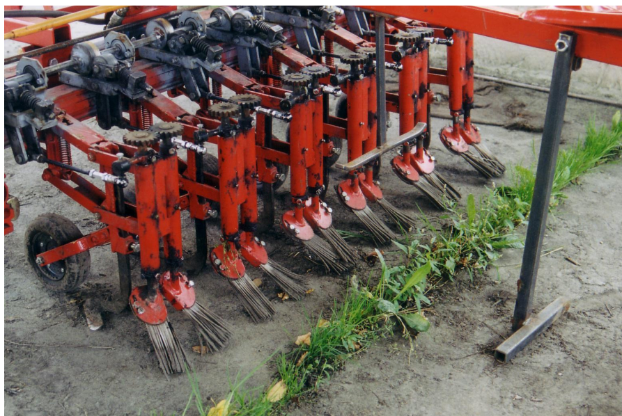
Abb. 9 Pinselfürste zur mechanischen Unkrautbekämpfung

1) Mehrfachnennungen möglich; 2) keine Containerkulturen: 8, keine Angaben: 11