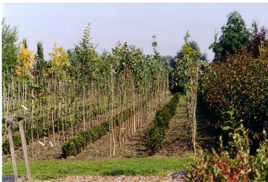
Abb. 2 Mischkultur in einem Freilandquartier

1) keine Angabe; 2) Mehrfachnennung möglich