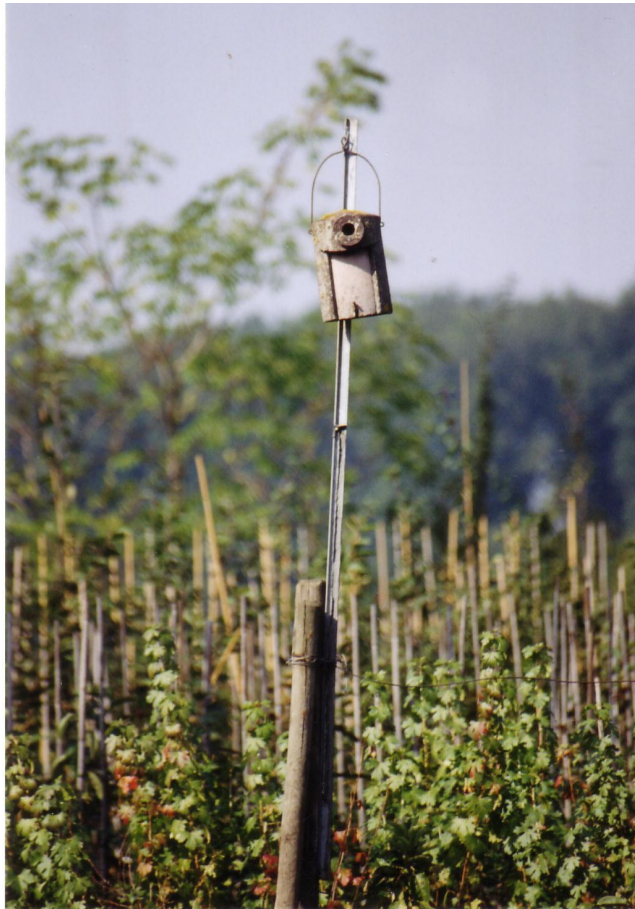
Abb. 6 Nistkasten in einem Freilandquartier