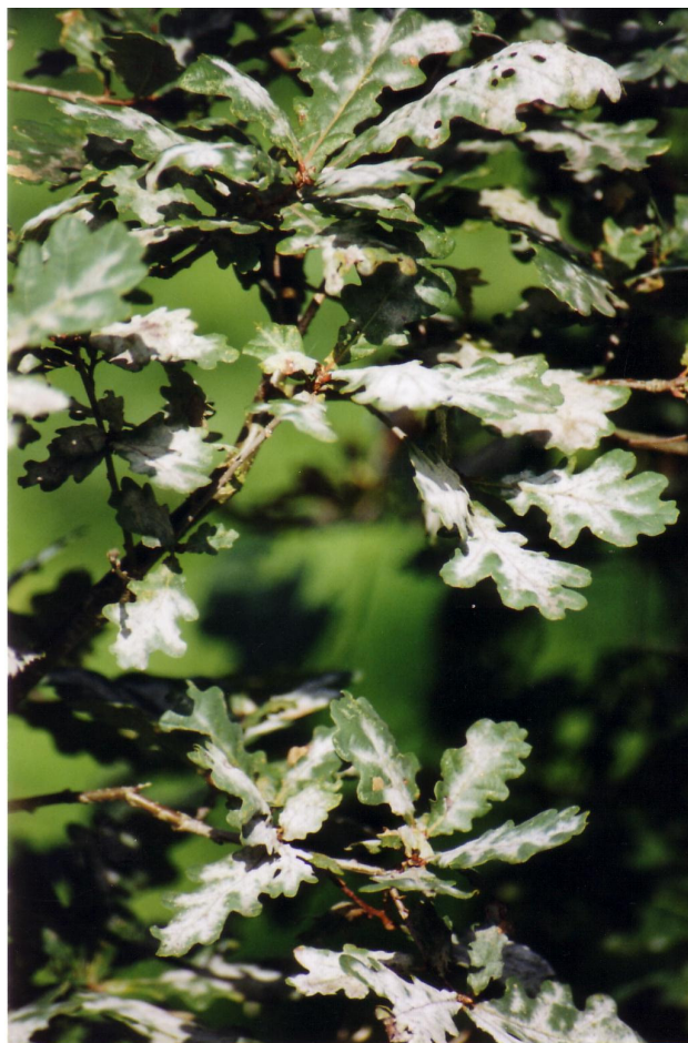
Abb. 5 Echter Mehltau ( Microsphaera alphitoides ) an Stiel-Eiche ( Quercus robur )