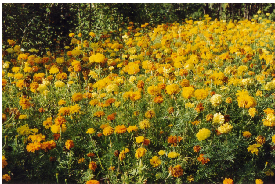
Abb. 8 Tagetes ( Tagetes spp.) als Zwischenfrucht zur Reduktion der Nematodenpopulationsdichte

1) Mehrfachnennungen möglich; 2) keine Angabe: 5 von 31 Betrieben, 10 Betriebe ergriffen keine Maßnahmen