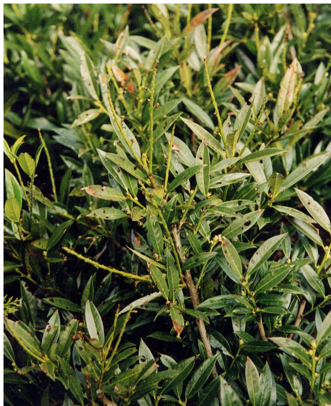
Abb. 4 Schrotschusskrankheit ( Stigmina carpophila ) an Kirschlorbeer ( Prunus laurocerasus )