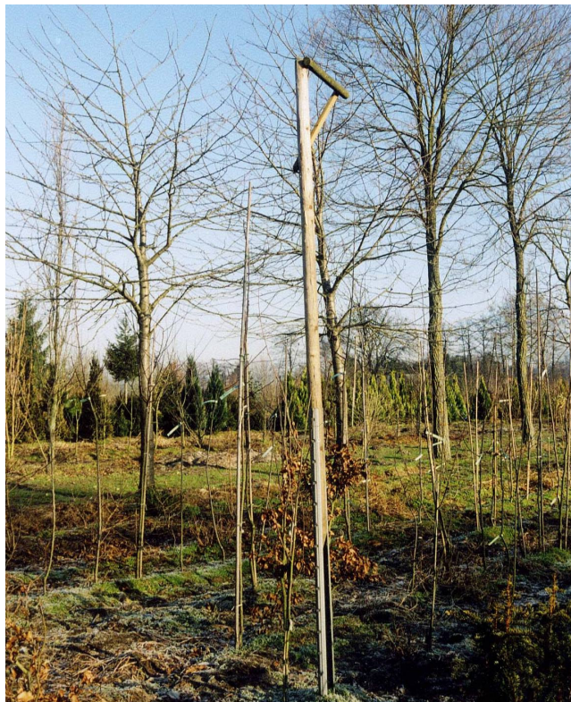
Abb. 7 Greifvogelsitzstange in einem Hochstammquartier