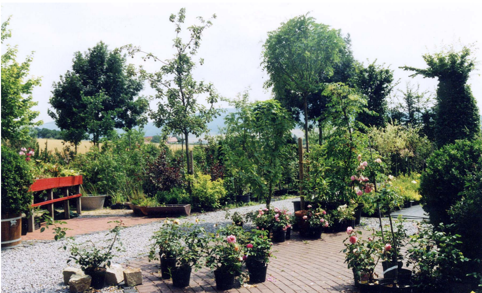
Abb. 1 Verkaufsquartier einer ökologisch wirtschaftenden Sortimentsbaumschule

1) Mehrfachnennung möglich; 2) keine Angabe: 0; 9 von 31 Betrieben waren Spezialbetriebe; 1 von 31 Betrieben war Sortiments- und Spezialbetrieb; k.A. = keine Angaben