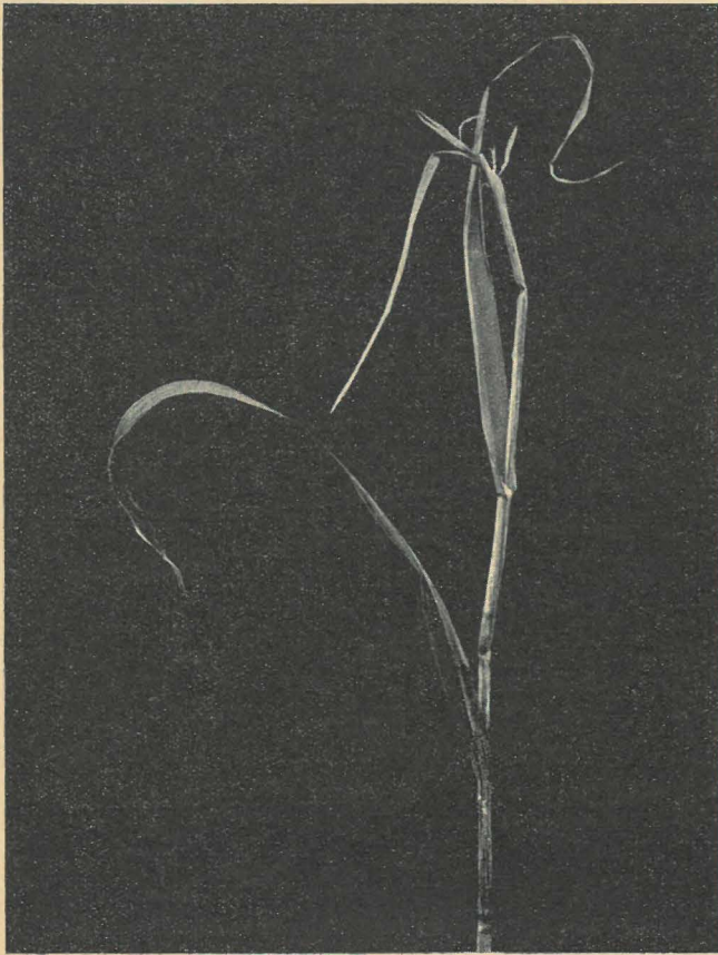
Schwer weißseuchetrante Haferpflanze.

Moorheiden ist von wechselnder, meist aber geringer Mächtigkeit. Sie liegt vielfach auf Bleichsand, unter dem Ortstein steht. Besonders heftig tritt die Krankheit an den Rändern abgetorfster Moorlinsen zutage. Dieser Heidehumus ist um so gefährlicher, je lockerer er liegt und je weniger er mit Sand untermischt ist. Er trocknet leicht aus, ist pulverig, puffig und sehr schwer durch Regen wieder anzufeuchten, so daß er vom Winde leicht verweht wird. Es sind uns jedoch auch Fälle begegnet, wo die Krankheit auf Sandheiden auftrat, deren Humusgehalt ganz gering war. Durch Trockenlegung, Umbruch und Mergelung wird die Flora plötzlich verändert. Unter den auftretenden Unkräutern dominieren meist die Knötericharten, besonders Polygonum persicaria L. und convolvulus L. Daneben kommen aber auch eine Menge anderer