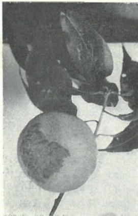
Abb. 1. Orig.

stark abhebenden Stellen waren knorpelig beschaffen und runzelig ausgebildet; die unbefallenen Stellen dagegen waren grün und glatt. Beim Ausschneiden der Früchte war übrigens festzustellen, daß sich die kleinen Wülste oder Runzeln nur oberflächlich befinden. Zum Teil, besonders wohl bei Frühbefall, waren die Früchte auch etwas geschrumpft, in ihrer Form mißgestaltet und fielen ähnlich den erkrankten Blättern später so stark ab, daß dem Obst-anbauer ein großer Verlust entstand. Der Befall wurde fast an jeder dort angebauten Sorte, besonders aber am