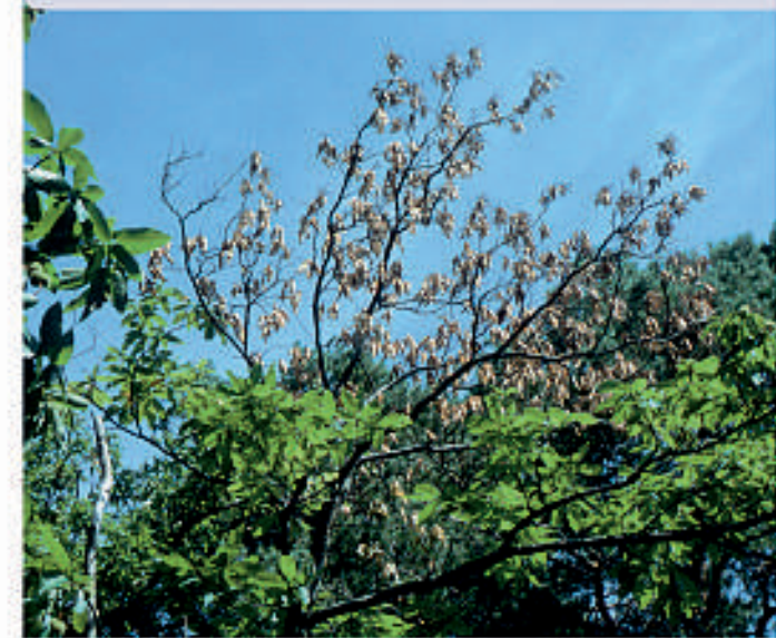
Kronenschaden durch Rindenkrebs