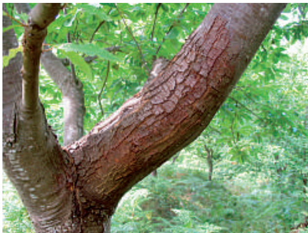
2. Massiver Rindenkrebs im Stammbereich

In Deutschland blickt vor allem der klimatisch begünstigte Südwesten auf eine lange Kastanienkultur zurück. Diese Tradition schlug sich in der Sprache, Literatur, Kunst und Wirtschaft nieder. Bereits die Römer verwendeten das Holz z. B. im Verbau sowie für Rebpfähle und Weinfässer. Auch die Früchte hatten als Nahrungsmittel und später als Spezialität eine große Bedeutung. Bewirtschaftet wird die Esskastanie überwiegend als Niederwald, d. h. nach der Holzernte nutzt man die Stockaustriebe zur Verjüngung des Bestandes. Aufgrund der Dauerhaftigkeit erfreut sich das Kastanienholz auch heute einer großen Nachfrage, z. B. für Lawinenverbauungen sowie im Garten- und Landschaftsbau.