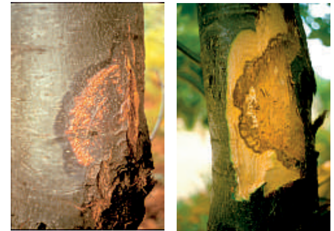
3. Befallsherd mit abgestorbenem Rindengewebe (links) und freigelegtem Kambiumschaden (rechts)

Systematisch gehört der Erreger des Kastanienrindenkrebses zu den Schlauchpilzen. Auf der abgestorbenen Rinde befallener Bäume bildet er zunächst die ungeschlechtlichen, pustelartigen Fruchtkörper (Pyknidien) (4). Bei feuchter Witterung brechen die Fruchtkörper auf und entlassen große Mengen von Konidien in Form langer gelber Sporenranken (4).