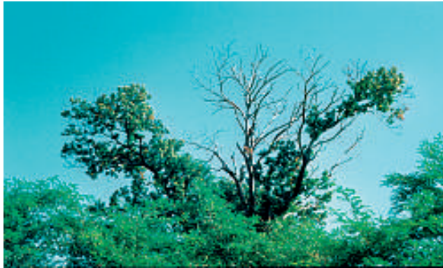
1. Schadbild nach mehrjährigem Krankheitsverlauf