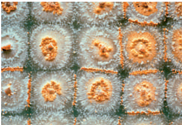
5. Kompatibilitäts-Test mit verschiedenen Erregerstämmen im Labor

In Europa gibt es unterschiedliche Konzepte zur Schadensbegrenzung. Eine Möglichkeit zum langfristigen Erhalt der Kastanien ist der Anbau widerstandsfähiger Züchtungen aus den weniger anfälligen, asiatischen Herkünften. Hoffnung für die europäischen Kastanienbestände verspricht auch die Tatsache, dass sich seit einigen Jahrzehnten abgeschwächte Stämme des Krankheitserregers ausbreiten. Diese Pilzstämme sind mit einem Hypovirus befallen und vermögen die Bäume somit nicht mehr lebensbedrohlich zu schädigen. Da die mindergefährlichen Erregerstämme jedoch in der Lage sind, aggressivere zu verdrängen, wird ihre Verbreitung durch gezielte sanitäre und waldbauliche Maßnahmen gefördert. Damit lässt sich zumindest das Schadausmaß in durchseuchten Wäldern und Kastanienfruchtthainen begrenzen. Vor allem in