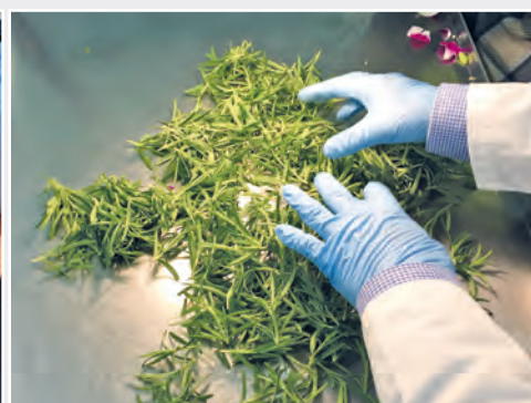
Rosmarin ist Wirtspflanze für Xylella fastidiosa Rosemary is host plant of Xylella fastidiosa

In 2015 and 2016, the potato brown rot bacteria Ralstonia solanacearum Race 1 occurred in several companies for cut roses. Eradication measures in the respective enterprises were promptly carried out with the technical advice of the Institute.