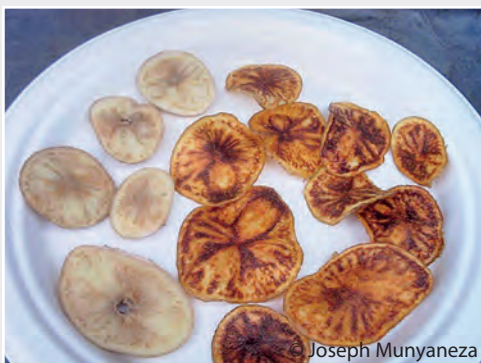
Zebra-Chips, verursacht durch Candidatus Liberibacter solanacearum Zebra chips caused by Candidatus Liberibacter solanacearum