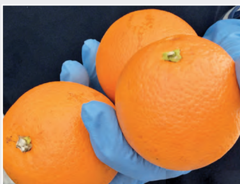
Untersuchung von Apfelsinen auf Phyllosticta citricapa Examination of oranges for Phyllosticta citricapa