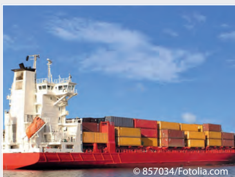
Weltweiter Handel mit Pflanzen und Pflanzenerzeugnissen nimmt zu Worldwide trade with plants and plant products is increasing

Das Institut ist die von Deutschland bei der Europäischen Union (EU) benannte nationale Koordinierungs- und Kontaktstelle für pflanzengesundheitliche Fragen im EU Rahmen nach Art. 4(2) der VO (EU) 2017/625 über amtliche Kontrollen. Es erstellt unter Einbeziehung der Pflanzenschutzdienste der Bundesländer und ggf. von Wirtschaftsverbänden Notfallpläne und Leitlinien, die vorgeben, wie Schadorganismen erkannt und pflanzengesundheitliche Maßnahmen durchgeführt werden sollen. Das Institut koordiniert für den Bereich Pflanzengesundheit die Erstellung und Weiterentwicklung der Integrierten Mehrjähri-