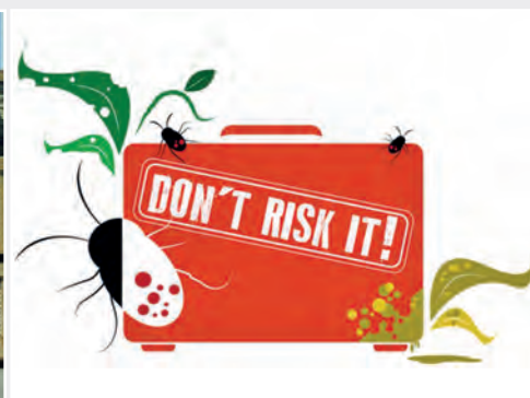
Pflanzliche Souvenirs: Geh kein Risiko ein Plants and plant products as souvenirs: Don't risk it