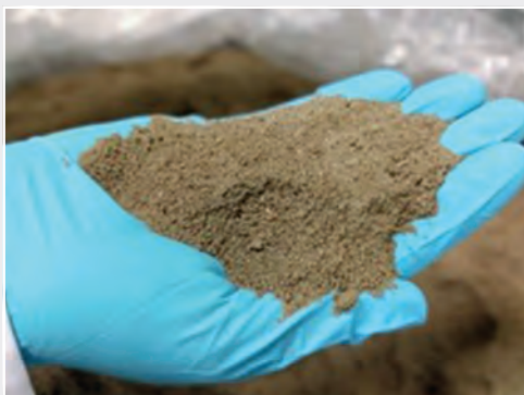
Risikofaktor: Resterde aus der Kartoffelverarbeitung Risk factor: Soil residues from potato processing

Schadorganismen können mit Reststoffen wie Erde aus der Kartoffelverarbeitung verbreitet werden, wenn diese in den landwirtschaftlichen Kreislauf zurück gelangen. In Kooperation mit der Universität Hohenheim und gefördert durch das Umweltbundesamt wurde die Wirksamkeit thermischer Klärschlammbehandlungsverfahren auf ausgewählte Pathogene der Phyto- und der Seuchenhygiene untersucht. Trotz der hygienisierenden Wirkung thermischer Verfahren konnte der Erreger des Kartoffelkrebses dabei nicht inaktiviert werden. Daher besteht ein hohes Risiko, dass sich dieser relevante Erreger bei der landwirtschaftlichen Verwertung von Reststoffen und -erden verbreitet. Verfahren, die zu einer vollständigen Inaktivierung dieses Schadorganismus führen, sind bisher nicht bekannt, so dass weitere Forschungen notwendig sind.