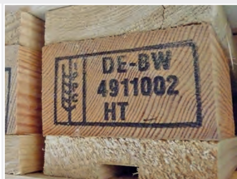
Die ISPM 15 Markierung kennzeichnet weltweit behandeltes Verpackungsmaterial aus Holz Worldwide, the ISPM 15 mark stands for treated wood packaging material

the Institute contributes in the development of German positions, their introduction in EU-discussions as well as in the implementation of the regulations in Germany.