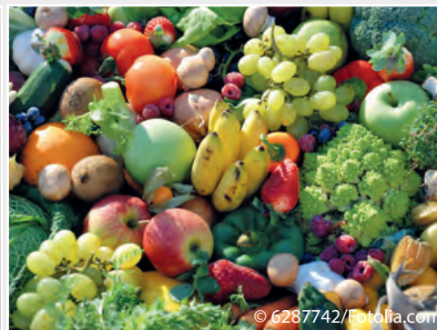
EU-Projekt DROPSA hat Ein- und Verschleppungsrisiko für Obstschadorganismen untersucht EU project DROPSA investigated the risk of introduction and spread of quarantine pests of fruits

risk exists that this relevant pathogen is distributed via agricultural use of residues and residual soil. Methods that lead to a complete inactivation of this harmful organism are not yet known so that further research is necessary.