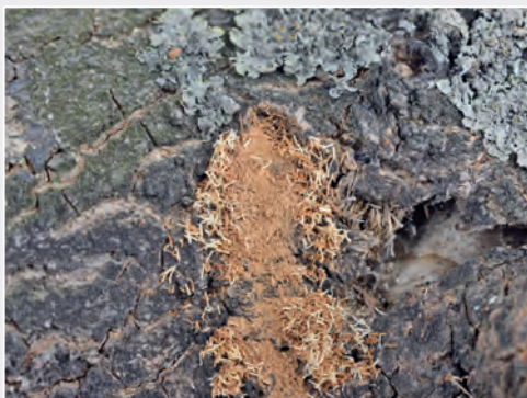
Fraßrückstände holzzerstörender Insekten als Grundlage für deren Identifizierung Feed residues of wood-destroying insects as basis for their identification

Im Fokus des vierjährigen EU-Projekt DROPSA stand die Erforschung und Verminderung des Risikos der Einschleppung und Verbreitung von Obst-Schadorganismen, die für die Länder der EU an Bedeutung gewinnen oder neue Bedrohungen darstellen. 26 Projektpartner aus Europa, Nordamerika, Ozeanien und Asien bestimmten die Ein- und Verschleppungswege der Kirschesigfliege ( Drosophila suzukii ), des Kiwikrebses ( Pseudomonas syringae pv. actinidiae ) und weiterer obstschädigender Organismen und erarbeiteten Bekämpfungsmaßnahmen. Das Institut hat innerhalb des Forschungsprojektes maßgeblich am Arbeitspaket zur Erstellung von Warnlisten möglicher Schadorganismen, die mit Früchten in die EU eingeschleppt werden könnten, mitgewirkt.