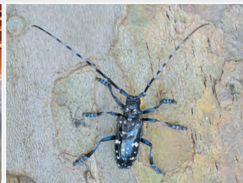
Anoplophora glabripennis , einer der schädlichsten Quarantäneschadorganismen der EU Anoplophora glabripennis is among the most harmful quarantine pests of the EU