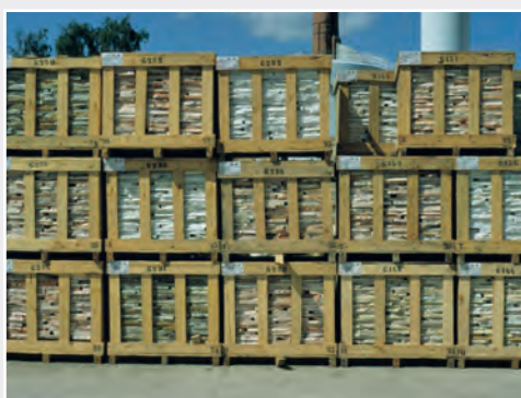
Verpackungsholz birgt Einschleppungsrisiko für Quarantäneschädlinge Wood packaging material bears the risk of introduction of quarantine pests