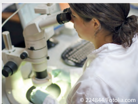
Referenzlabor für Quarantäne- und neue Schadorganismen Reference laboratory for quarantine and new pests

Das EU-System zur Pflanzengesundheit und zu amtlichen Kontrollen wird seit 2013 neu ausgerichtet. Das Institut war in die Erarbeitung der Verordnungen (EU) 2016/2031 und (EU) 2017/625 eingebunden, die ab 14.12.2019 anzuwenden sind. Es ist auch fortlaufend auf verschiedenen Ebenen an der Erarbeitung und Aktualisierung der Durchführungsrechtsakte und Verwaltungsvorschriften beteiligt. Hierfür sind auf Experten- und EU-Ratsarbeitsgruppenebene deutsche Positionen zu entwickeln, in die EU-Diskussion