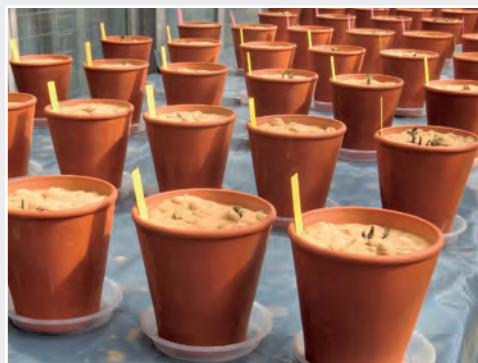
Projekt zur Inaktivierung von Kartoffelzysten-nematoden in Resterde Project for inactivation of potato cyst nematodes in soil residues