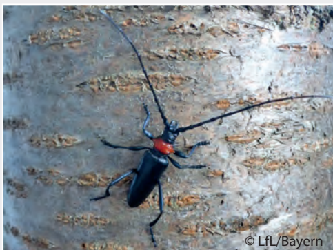
Aromia bungii mit hohem Schadpotenzial Aromia bungii with high potential for damage

2016 trat in Deutschland die Bakterienkrankheit Xylella fastidiosa ssp. fastidiosa erstmals auf. Befallen waren Topfpflanzen im Gewächshaus eines Betriebes. Das Institut führte bei Xylella die Referenzuntersuchungen durch und beriet die zuständigen Pflanzenschutzdienste zu den notwendigen Ausrottungsmaßnahmen entsprechend Durchführungsbeschluss (EU) 2015/789 und der Abgrenzung der Befalls- und Pufferzone. Zudem erstellte es in Abstimmung mit den