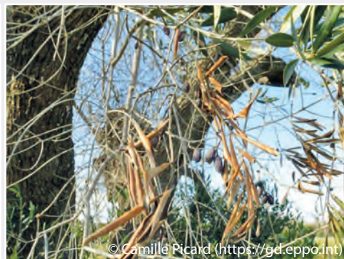
Olivenbaum mit Xylella -Befall Olive tree with Xylella -infestation

International Plant Protection Convention (IPPC). Thus, the staff members are significantly involved in the preparation of mandatory EC-regulations and international phytosanitary standards.