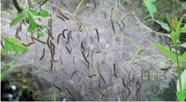
Pflaumengespinstmotte: Larven im Gespinst an Weißdorn