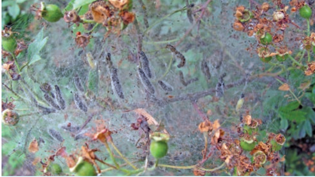
Pflaumengespinstmotte: Puppenkokons im Gespinst an Weißdorn