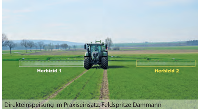
Direkteinspeisung im Praxiseinsatz, Feldspritze Dammann

treu wieder. Durch die rasante technische Entwicklung im Bereich der Sensorik und der Robotik liegt hier ein enormes Potenzial, das in den kommenden Jahren zu vielen Innovationen und Verbesserungen im Versuchswesen beitragen wird. Dabei wird die neue Technologie die klassische Bonitur mit fachkundigem Personal nicht vollständig ersetzen, sie ist jedoch sehr hilfreich.