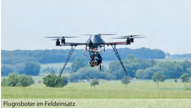
Flugroboter im Feldeinsatz