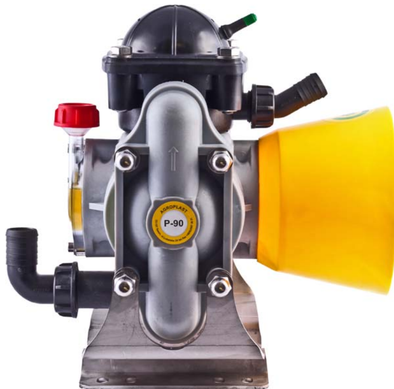
Zweikammer-Membranpumpe Agroplast „P-90“

Bundesforschungsinstitut für Kulturpflanzen, Braunschweig