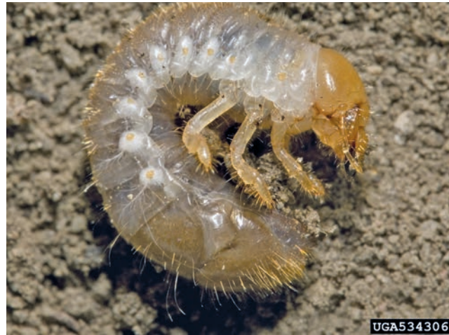
3. Popillia japonica - Larve