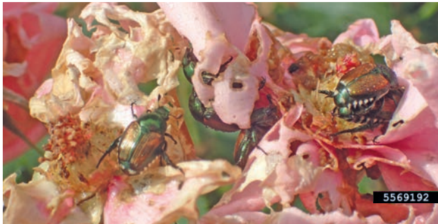
7. Fraßschäden an Rosenblüten

Wie kann das Einschleppen und Verbreiten verhindert werden?