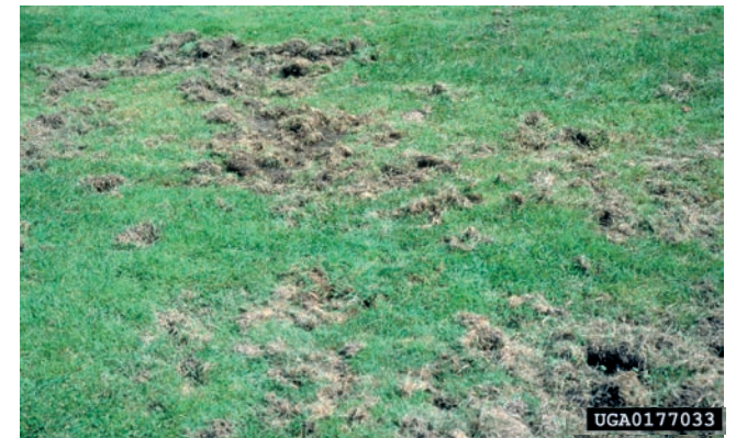
4. Schaden an einer Wiese durch die Larven des Japankäfers

Zierpflanzen: Calluna vulgaris (Heide), Dahlia sp., Aster sp., Zinnia sp. u.a. sowie die Ziergehölze Thuja sp., Syringa sp. (Flieder), Virburnum sp. (Schneeball) u.a.