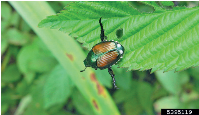
2. Typisches Verhalten des Japankäfers bei Gefahr

Die Engerlinge (Larven) unterscheiden sich von anderen Engerlingen durch v-förmig angeordnete Borsten am hintersten Körpersegment. Die Puppe gleicht der Form nach einem erwachsenen Käfer.