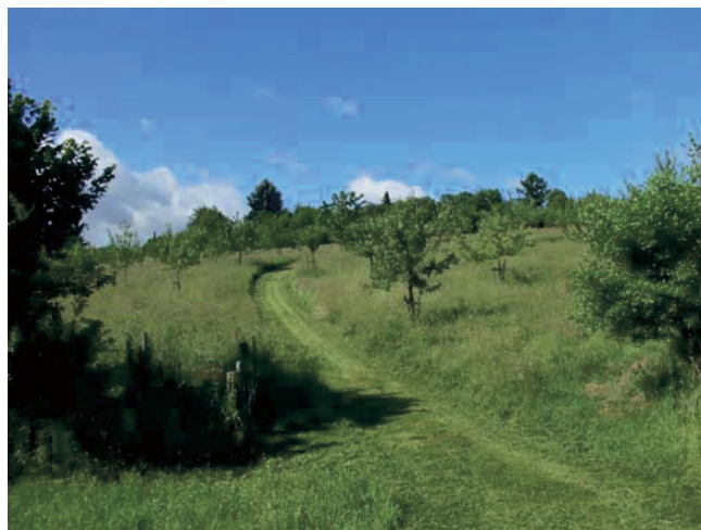
Abb. 1. Die Oberlausitz Stiftung hat 2006 eine 2,5 ha große Wiese erworben und dort mehr als 200 hochstämmige Obstbäume unterschiedlicher Sorten angepflanzt. Entstanden ist so ein „Obstsortengarten der Oberlausitz“

Für einen möglichst langen Erhalt der Obstsorten wurden mehr als 95% der Sorten in Ostritz auf Hochstämmen als Ein-Sorten-Bäume angepflanzt. Der Pflanzabstand betrug je nach Sorte 8–12 Meter. Auf Fungizide wurde und wird völlig verzichtet. Dadurch eröffnet sich die Möglichkeit, die Vitalität der angebauten Sorten „ungeschminkt“ beobachten zu können.