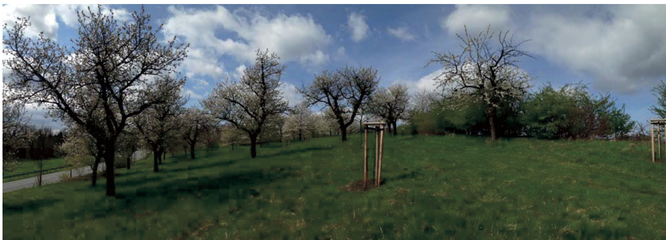
Abb. 2. Streuobstwiese mit historischen Obstsorten der Oberlausitz-Stiftung