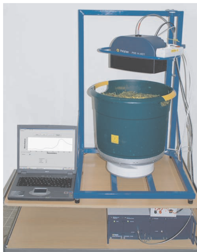
Abb. 1. Messeinrichtung mit Spektrometer PSS 1720, Bandmesskopf (Polytec GmbH) und Drehbühne.

Die gehäckselten Proben, ca. 27 l, bzw. 2–8 kg, je nach Fruchtart und Trockensubstanzgehalt, befinden sich während der Messung in einem Aufnahmegefäß, das unter einem fasergekoppelten Messkopf rotiert, der die Probenoberfläche abscannt. Um ein repräsentatives Mittelwertspektrum der Probe zu gewinnen, wurde in sechs-