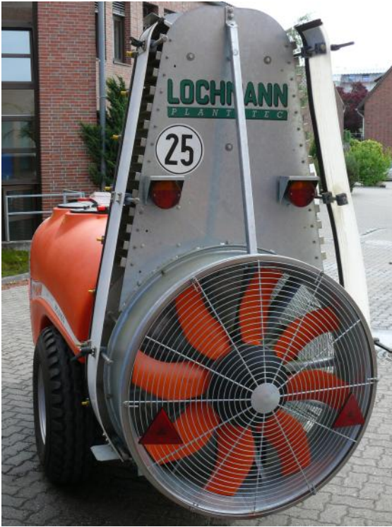
Abb.2: 900 mm Axialgebläse mit Luftleitgehäuse und manuellen „Luftabdeckungen“ (optional). Aktuell werden hydraulisch angetriebene Abdeckungen verbaut.

Das Gerät besteht aus einem feuerverzinkten Stahlprofilrahmen mit aufgesetztem Kunststofftank. Die maximale Gerätebreite beträgt 1400 mm. Das Gerät ist ausgelegt für 25 km/h Transportgeschwindigkeit auf öffentlichen Straßen. Die Anhängung erfolgt an den Unterlenkern des Traktors.