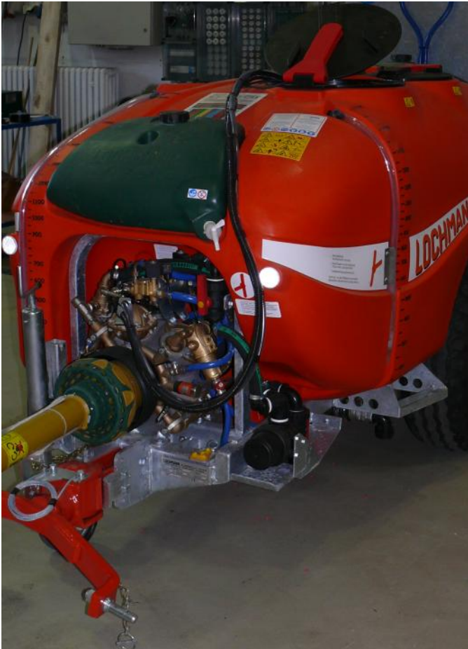
Abb.4: Frontansicht mit Tankinhaltsanzeiger, Pumpe und Handwaschtank.

Dies ermöglicht abdriftarmes Arbeiten im Randbereich der Obstanlage.