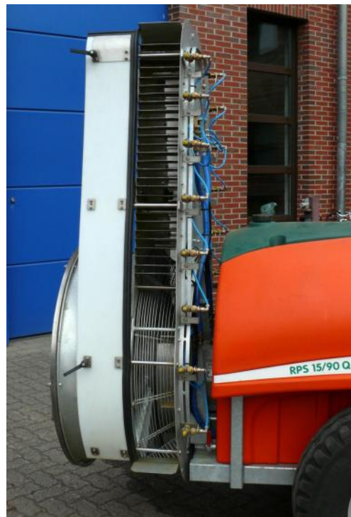
Abb.3: Seitenansicht des 90 Q-Gebläses mit zusätzlicher, manueller, einseitiger „Luftabdeckung“.

Das 90 cm Axialgebläse ist mit Propellerblättern aus Kunststoff und einem Luftleitgehäuse aus verzinktem Blech ausgestattet. Das 90 Q-Gebläse saugt die Luft auf der Rückseite an. Optional kann das Gebläse mit einem hydraulisch bedienbaren Luftabdeckblech ausgestattet werden. Hierdurch kann eine Gebläsesseite ohne Luftunterstützung arbeiten.