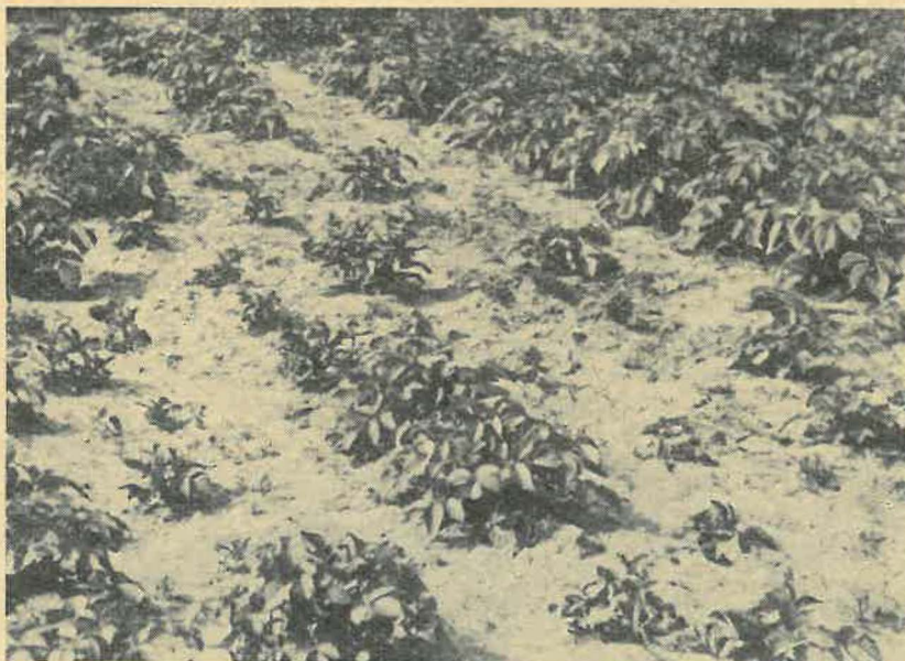
Abb. 1 Verunkrautete Flecken sind Anzeichen für Nematodenbefall im Kartoffelbestand

Besonders eindrucksvoll ist auch die Überwucherung der befallenen Bestandteile durch das Unkraut. — Das oberirdische Bild findet seine Erklärung, wenn man die Pflanzen vorsichtig aus dem Boden hebt. Man erkennt dann an allen unterirdischen Teilen der Kartoffelpflanzen etwa von der 7. Woche nach der Pflanzung an kleine Anschwellungen, die besonders zahlreich an den Hauptwurzeln sitzen. In den nächsten Wochen treten diese Körper von der Größe eines Stecknadelkopfes immer deutlicher hervor und verfärben sich allmählich von Weiß über ein sattes Gelb bis zu einem rötlichen Braun. Es handelt sich dabei um die reifen-