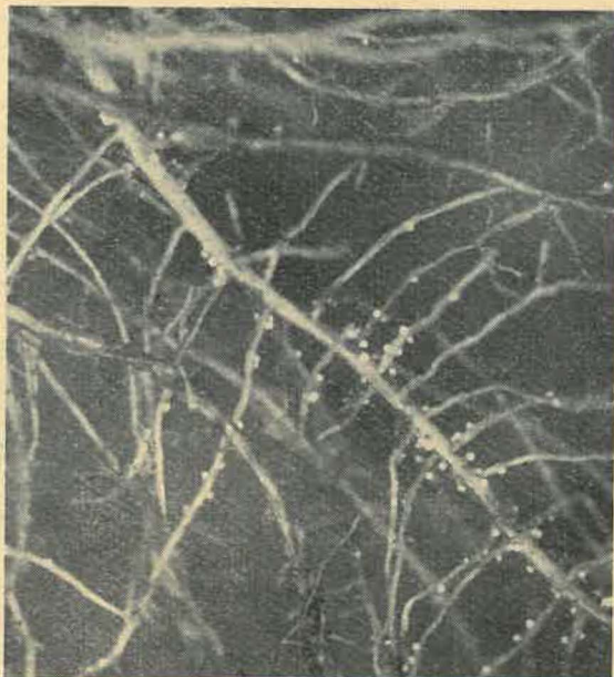
Abb. 2 * Unreife und reife Zysten an Kartoffelwurzeln

den Weibchen des Kartoffelnematoden, die in ihrem Innern die Eier der nächsten Älchengeneration bergen und sich nach weiteren zwei bis drei Wochen von den befallenen Wurzeln, Tragfäden und jungen Knollen ablösen. Da der Befall der auflaufenden Kartoffeln vom Boden her durch die Nematodenlarven nicht gleichzeitig erfolgt, findet man meist während der Überprüfung mehrere Entwicklungsstufen des Schädling an der gleichen Pflanze. Bei starkem Befall, der an den unterirdischen Organen einer Kartoffelpflanze bis zu 50 000 Zysten aufweisen kann, bräunen sich die Wurzeln und vermorschen, während neue Faserwurzeln büschelartig übereinander angelegt werden können, so daß ein eigenartiges Wurzelbild entsteht.