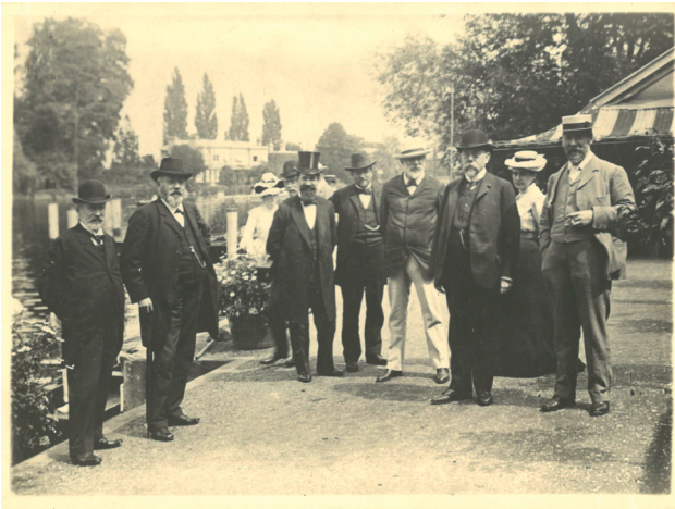
Abb. 1: Walter Kempner (3. von links), Robert Koch (3. von rechts), Lydia Rabinowitsch-Kempner (2. von rechts) auf dem britischen Tuberkulosekongress 1901.

Foto belegt (s. Abb. 1). Zwei Jahre später, vermutlich im Zusammenhang mit der nun vertretenen Auffassung einer geringen praktischen Bedeutung des bovinen Erregers für die Tuberkulose beim Menschen, verließ Lydia Rabinowitsch-Kempner das Institut. Überzeugt, dass Rindertuberkulose insbesondere für Säuglinge und Kleinkinder eine erhebliche Rolle spiele, setzte sie 1904 ihre Arbeit zu Tuberkelbazillen in der Milch am pathologischen Institut der Charité fort. 1908 bestätigte Robert Koch auf dem Tuberkulosekongress in Washington Nachweise von Erregern des bovinen Typus beim Menschen, forderte jedoch zu untersuchen, ob sie auch Lungentuberkulose hervorrufen könnten. 11 Wie entschlossen Lydia Rabinowitsch-Kempner gewesen sein muss, um zur geforderten Beweislage beizutragen, belegen ihre Briefe an ihren Förderer Paul Ehrlich: „Ein derartiger Nachweis lässt sich naturgemäss nur durch bakteriologische Bearbeitung eines größeren Materials erbringen. [Es sind...] zur Beantwortung einer so überaus wichtigen Frage eine große Anzahl von Versuchstieren erforderlich [...] Da das pathologische