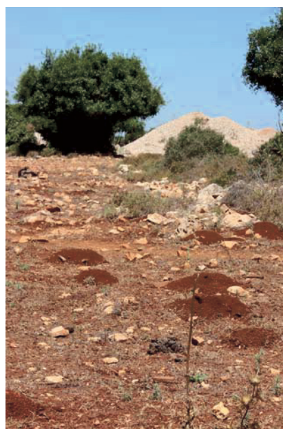
Abb. 4. Roterde (Terra rossa).