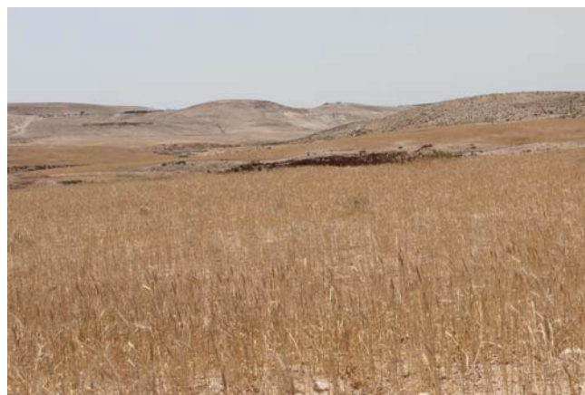
Abb. 7. H. bulbosum in der Negev-Wüste.

Weitere sechs Standorte in der Nähe des 100 m u.d.M. gelegenen Sees Galilea (Abb. 9) bis hin zum Mt. Meron mit einer Höhe von 1200 m ergänzten die Sammlung. Die jährlichen Niederschlagsmengen reichen hier von 470 bis 900 mm.