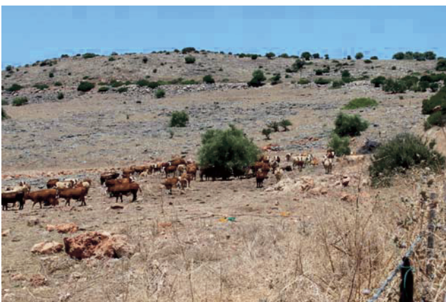
Abb. 11. Intensive Weidewirtschaft gefährdet die H. bulbosum -Bestände.

Im Verlauf der Reise konnte ein Drittel der geplanten H. bulbosum -Kollektion gewonnen werden. In ersten Tests wurden Akzessionen mit Resistenz gegen die Netzfleckenkrankheit identifiziert, einer Gerstenkrankheit, die in Israel aufgrund ihres epidemischen Auftretens in den 1950er Jahren zum starken Rückgang des Gerstenanbaues führte. Nach vorläufigen Ergebnissen aus den Virusresistenzprüfungen konnten zwei von 70 getesteten Pflanzen aus 21 Akzessionen nicht mit dem Gerstengelverzweigungsvirus (BYDV-PAV) infiziert werden. Eine Weiterführung der Arbeiten ist im Rahmen der bilateralen Kooperation geplant.