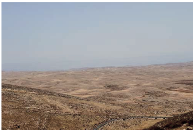
Abb. 6. Felswüste des Jordantals als Folge des Kahlschlags ehemals flächendeckender Wälder.

gen ist dies die trockenste Region, in der wir H. bulbosum -Ähren sammelten.