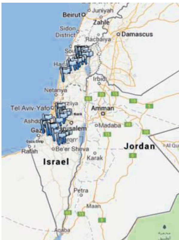
Abb. 1. Übersicht zu den 37 Sammelorten von Hordeum bulbosum (Fähnchen).