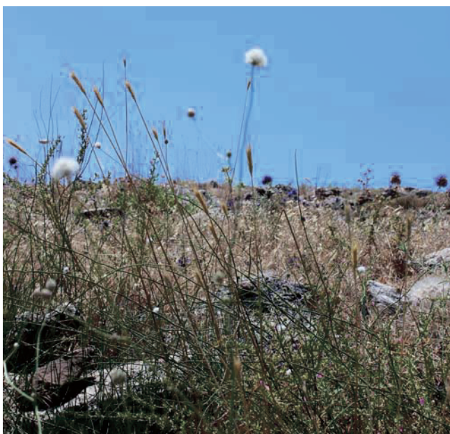
Abb. 3. Pflanzenbestand mit H. bulbosum .