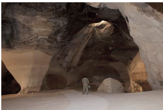
Abb. 5. Glockenhöhle im Nationalpark Bet Guvrin-Maresha.

Am folgenden Tag fuhren wir in südliche Richtung in die Negev-Wüste bis an die jordanische Grenze (Abb. 6). Die 100 bis 200 m hoch gelegene Negev-Wüste nimmt 60% des Landes ein. Charakteristisch für diese Region ist der trockene, lösshaltige, braune Boden. In den Wintermonaten fallen 300 bis 400 mm Niederschlag. Wir trafen hier auf nomadisierende Beduinen. Die intensive Beweidung mit Schafen und Ziegen übt auf die Vegetation der Halbwüsten einen starken Selektionsdruck aus (fünf Sammelpunkte). In südliche Richtung weiterfahrend setzten wir unsere Sammlung in 400 bis 800 m Höhe auf dem Mt. Hebron fort (fünf Sammelpunkte). Die Bodentypen wechseln hier von kalkreichen, oft dunkelgraubraunen Rendzinen über gelbe, sehr kalkhaltige, lehmig bis sandig lehmige Steppenböden bis zu den schon bekannten mediterranen Roterden. Mit jährlich 200 bis 250 mm Niederschlä-