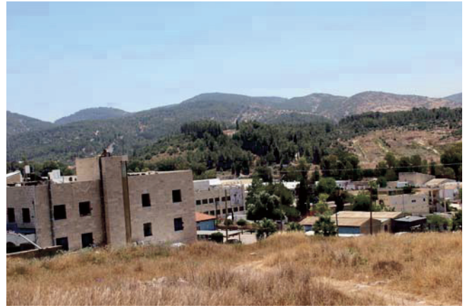
Abb. 10. Zunehmender Industrie- und Siedlungsbau verdrängen die natürlichen Standorte der Wildpflanzen.