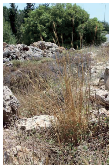
Abb. 8. H. bulbosum auf einem Standort vulkanischen Ursprungs.