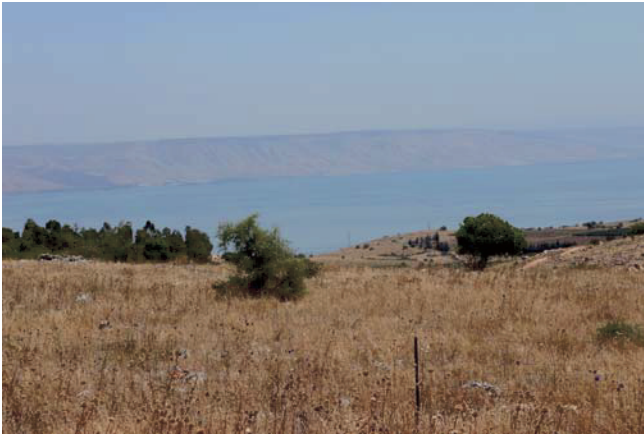
Abb. 9. Blick auf den See von Galilea.