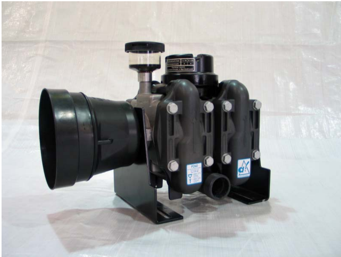
Vierkammer-Membranpumpe P 260

Julius Kühn-Institut Bundesforschungsinstitut für Kulturpflanzen, Braunschweig (ehemals Biologische Bundesanstalt - BBA)