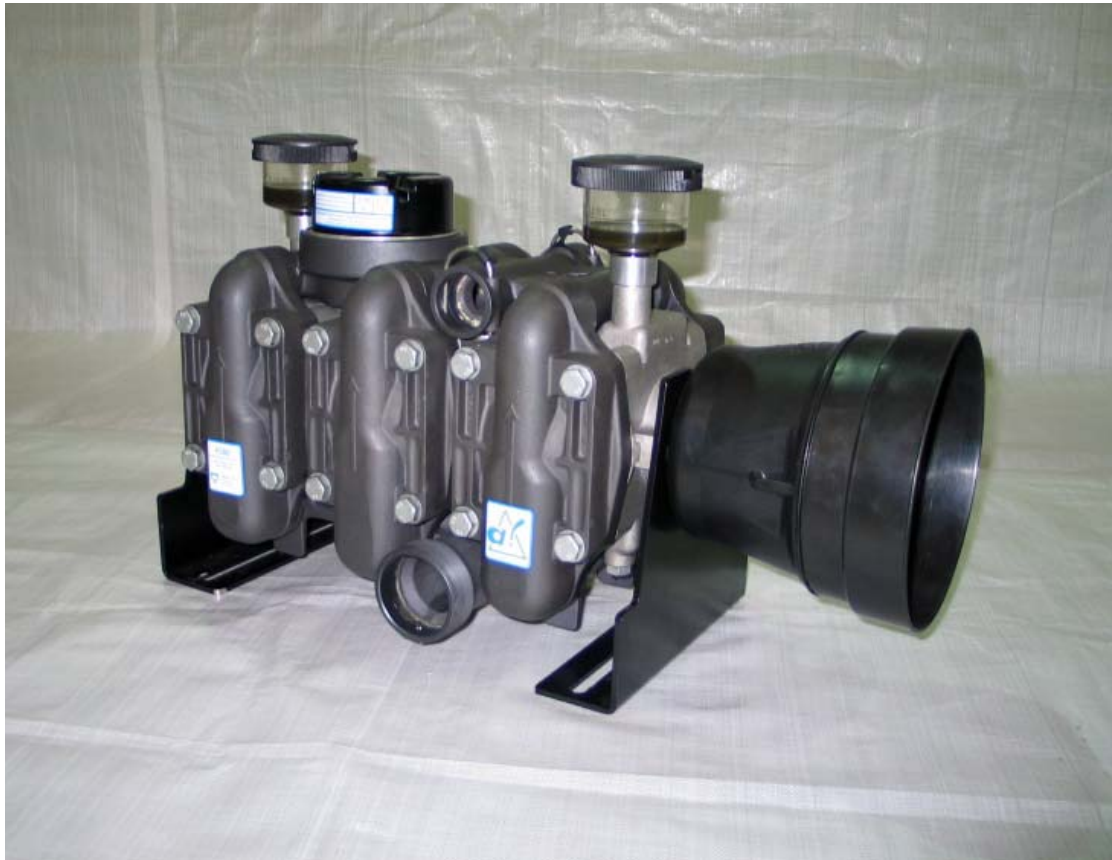
Sechskammer-Membranpumpe P 380

Julius Kühn-Institut Bundesforschungsinstitut für Kulturpflanzen, Braunschweig (ehemals Biologische Bundesanstalt - BBA)