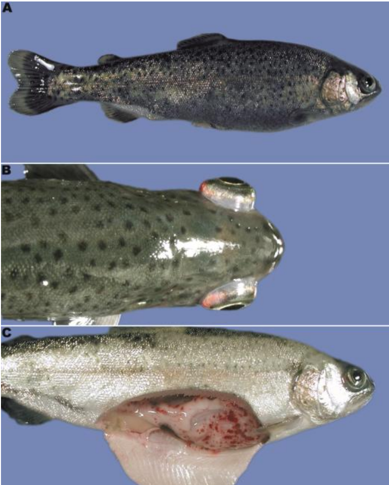
Abb. 1: An VHS erkrankte Forellen mit Dunkelfärbung der Haut (A), Exophthalmus (B) und petechialen Hämorrhagien in der Muskulatur und auf inneren Organen (C)